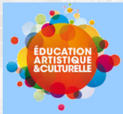
PARCOURS D'ÉDUCATION ARTISTIQUE ET CULTUREL