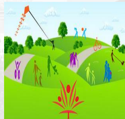
PARCOURS ÉDUCATIF DE SANTÉ