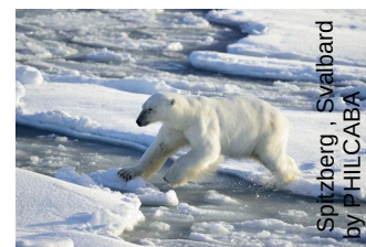
Spitzberg, Svalbard